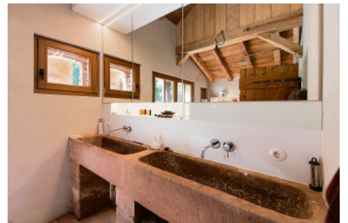
Wiederverwert: gestern Futtertrog, heute Waschbecken