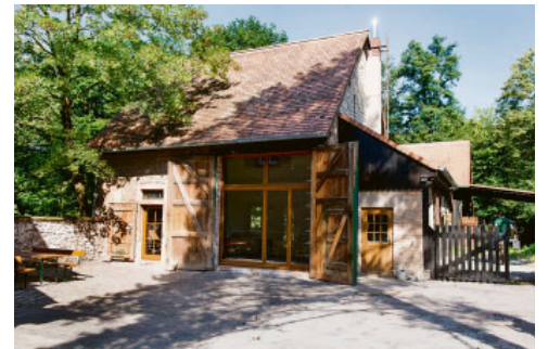
Naturstein: Die alte Scheune zeigt, was sie ausmacht.