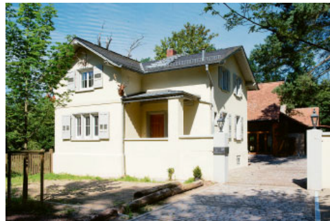
Schlichter Klassizismus: Wo einst der Jäger wohnte, hat nun das Architekturbüro seinen Sitz.

Das Anwesen, das die beiden besichtigen, hatte damit auf den ersten Blick nicht mehr viel gemein. Dunkle Nadelbäume, Verbliebene der früheren Weihnachtsbaumschule, drängten sich auf dem Grundstück und schirmten das Haus gegen Blicke ab. Trotz aller Begeis-