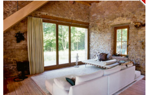
Gewagt? Die Kombination aus Jagdtrophäen und Designklassikern funktioniert.