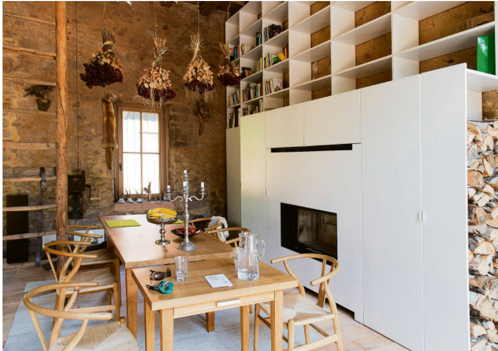
Wohnen wie im Urlaub: Dieser Eindruck entsteht auch, weil die neuen Bewohner so wenig wie möglich verändert haben, um aus der Scheune ein Wohnhaus zu machen.